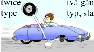
tyre däck, ring