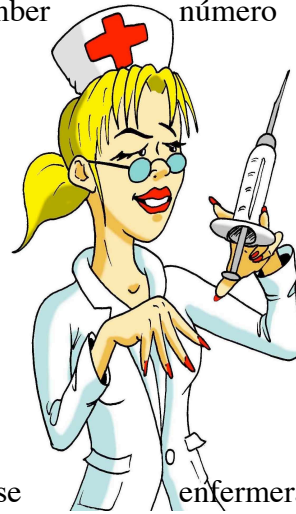
nurse enfermera nut nuez